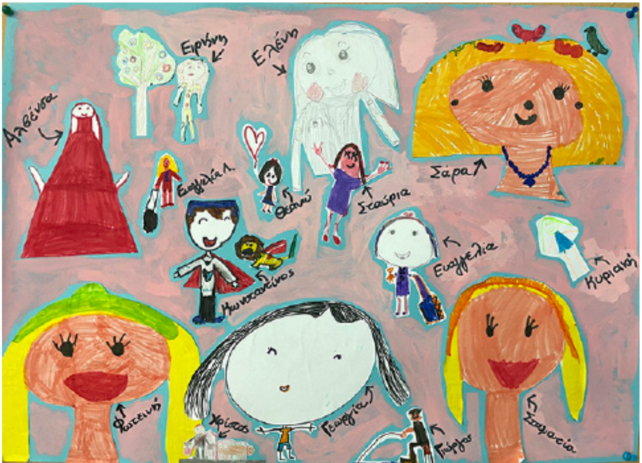
Δραστηριότητα 1: “Το πορτρέτο της τάξης μου”. Ομάδα 1: “Οι καλόκαρδοι” (Θεανώ, Σταύρια, Ειρήνη, Ελένη, Σάρα)